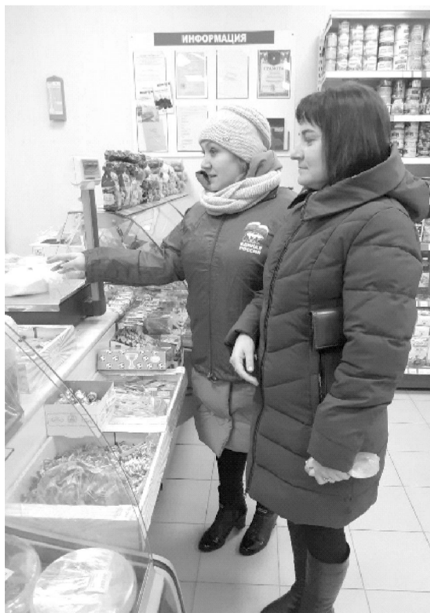
работает уже давно и охватывает практически все сферы жизни, где речь идёт

располагаться голографическая наклейка государственной поверки с непросроченной датой. Не проверяются лишь весы, которым нет года. Затем поверка должна проводиться каждый год, а отметка заноситься на прибор. Данное требование не всегда соблюдается, из-за чего "Народный контроль" поставил задачу - проверить магазины. "Народный контроль"