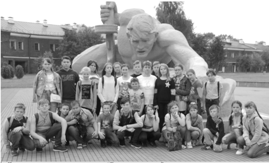
Посещение мемориального комплекса "Брестская крепость".

тересными и разнообразными мероприятиями. Такие спортивные соревнования, как "Малые олимпийские игры", "Фитбол", "Быстрые, ловкие, смелые", "Спортивный калейдоскоп", "Мини-футбол" пользовались огромной популярностью у отдыхающих. Дети играли и получали огромное удовольствие, а также грамоты и сладкие подарки за побе-