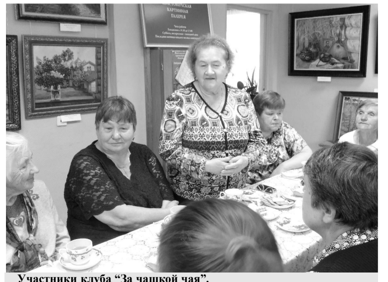
Участники клуба "За чашкой чая".